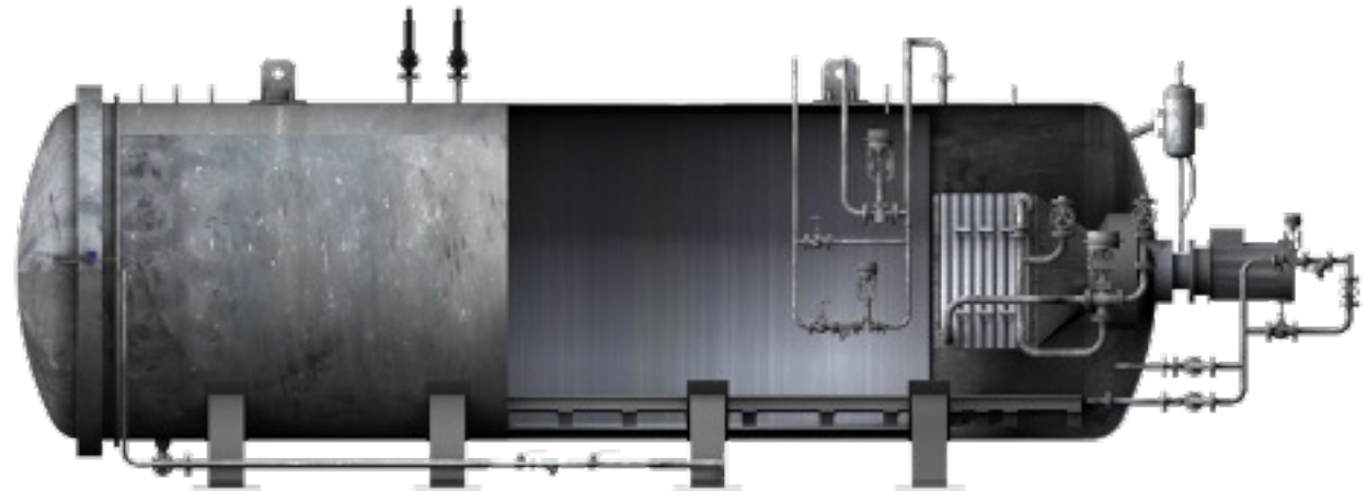
Autoclave para vulcanizado.