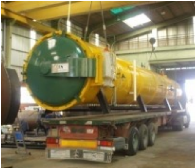
Autoclave para tratamiento de madera.

A pesar de que en BMT Boilers nos encargamos del desarrollo, diseño, cálculo, adecuación, fabricación e implementación de nuestros productos, también realizamos equipos y proyectos bajo plano respaldados por muchos años de experiencia en el sector metal-mecánico en la fabricación de bienes de equipo para empresas.